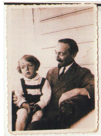
Tėvas su sūnumi 1933 metais.

Pedagogas šeimoje. Galbūt juokais skundėsi kolegoms, kad „ studentus lengviau auklėti negu savo sūnų “. Savo sūnui dažnai pasakodavo atsitikimus iš savo jaunystės, kelionių, taip pat pritaikytus jo supratimo lygiui siužetus iš istorijos ar grožinės literatūros (pvz., Šekspyro, A. Mickevičiaus tekstus). Kantriai atsakinėdavo ir į keistus, nepabaigiamus klausimus. Atlaidus vaikiškoms išdaigoms, bet griežtai fiziškai bausdavo už melavimą. O kai sūnaus ašarėlės nudžiūdavo, meiliai pasisodinęs paaiškindavo, esą tai buvę būtina padaryti, kad ateityje tavimi kiti pasitikėtų ir gerbtų. Iš tikrųjų sūnus nejaučia jokių nuoskaudų už tas skausmingas pamokas, o priešingai tik dėkingas Tėvui už įskiepytą meilę tiesai.