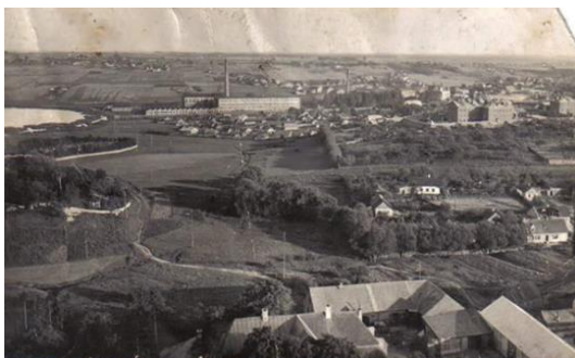
Mokykla stovi Šalkauskių giminės žemėje.