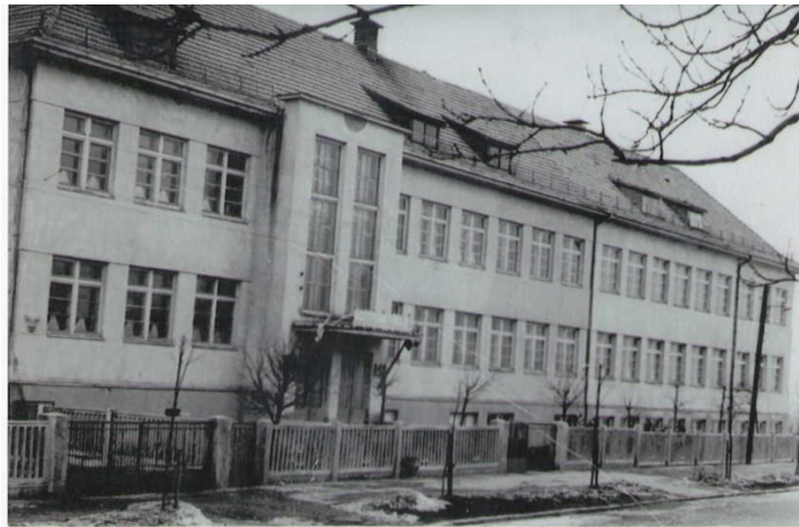
Mokykla po 1959 metų rekonstrukcijos

1952 m. mokykla perorganizuota į 6-ąją septynmetę. Nuo 1956 m. ji pavadinta 7-ąja vidurine mokykla. 1959 m. prie senojo mokyklos pastato pastatytas pirmasis priestatas, o 1967 m. – antrasis.