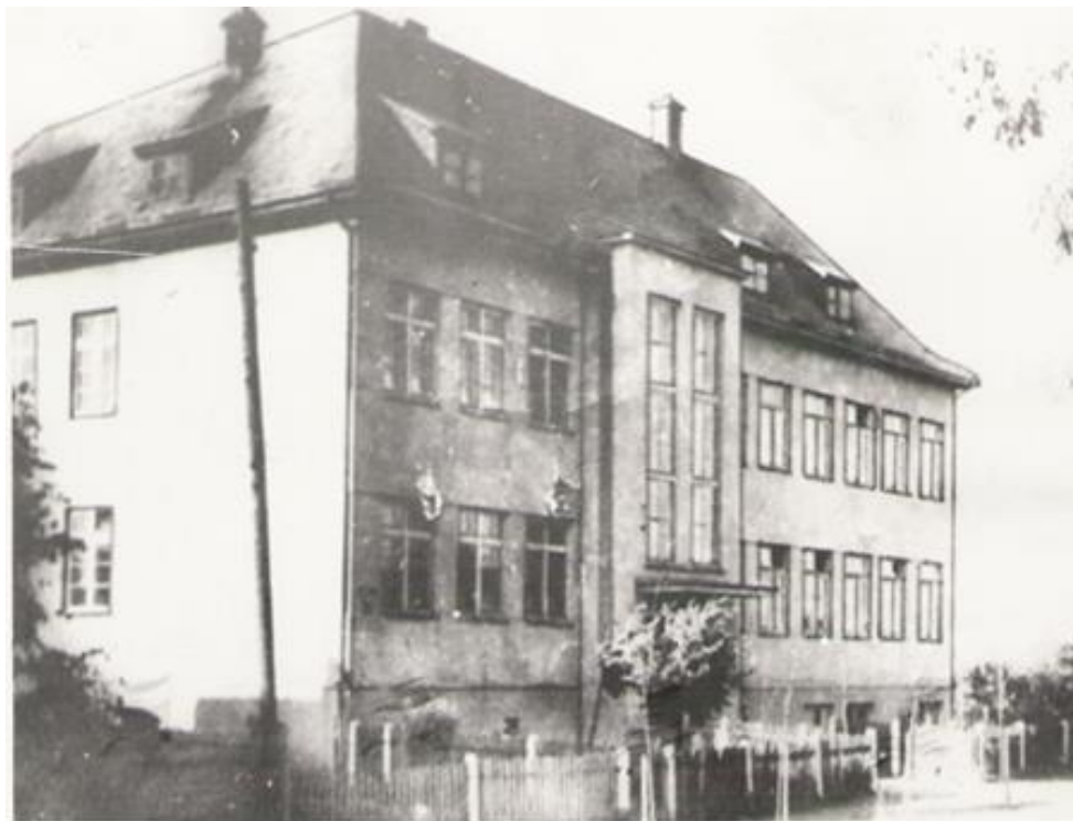
Mokykla 1938 metais

Mokykla, kurią dabar vadiname Stasio Šalkauskio gimnazija, įkurta 1938 metais. Pirmąją mokyklos pastatą tada vadinoje Trakų gatvėje sudarė du aukštai ir pusrūsis. Joje dirbo aštuoni mokytojai. Mokykla buvo pastatyta valstybės lėšomis. Tais pačiais metais iš privataus namo čia perkelta 4-oji pradinė mokykla.