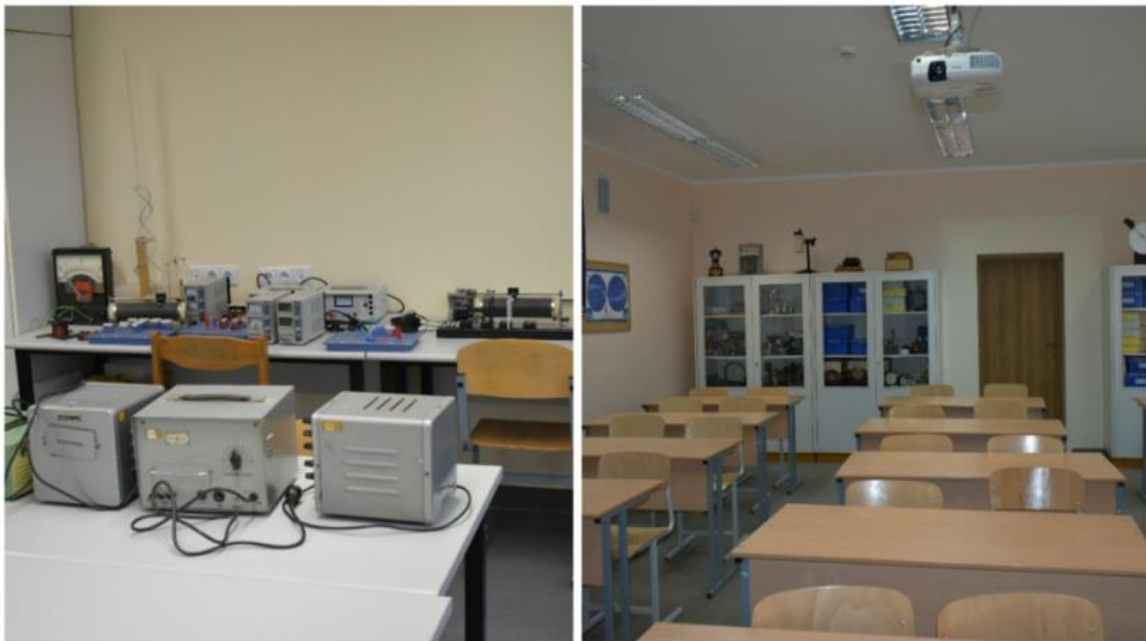
Fizikos kabinetas ir laboratorija

2016 m. liepos 4 dieną Šiaulių Stasio Šalkauskio gimnazija pasirašė bendradarbiavimo sutartį su Vilniaus Gedimino technikos universitetu dėl VGTU klasės kūrimo mūsų gimnazijoje, todėl 2016 metų rugsėjo 1 d. įsteigta VGTU klasė. Net 15 mūsų gimnazijos gimnazistų davė įžodį ir tapo JAUNAISIAIS ŠAULIAIS - papildė Šiaulių gen. P. Plechavičiaus šaulių 6-os rinktinės narių gretas. Taigi, pirmą kartą gimnazijoje įkurta Šaulių klasė.