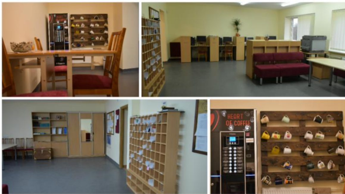
Mokytojų kambarys ir jauki virtuvėlė

2014 m. prasidėjo mokyklos kapitalinis remontas, finansuojamas valstybės lėšomis. Jo metu pakeistos sporto salės grindys, sutvarkyta aerobikos salė, renovuoti vandentiekis ir kanalizacija, įrengtos kriauklės bei pakeistos grindys kabinetuose, įrengta vėdinimo sistema. 2015 m. atnaujintas mokyklos fasadas, suremontuota palėpė, aktų salė, pakeistos pagrindinio įėjimo durys. 2016 m. į kitas patalpas persikėlė biblioteka, skaitykla, muziejus, fizikos, muzikos kabinetai, mokytojų kambarys su virtuvėle, rekonstruotas technologijų kabinetas, pradėtas įrenginėti liftas.