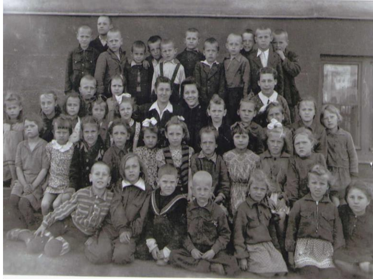
Mokiniai prie mokyklos 1949 m.

1952 m. mokykla perorganizuota į 6-ąją septynmetę. Nuo 1956 m. ji pavadinta 7-ąja vidurine mokykla. 1959 m. prie senojo mokyklos pastato pastatytas pirmasis priestatas, o 1967 m. – antrasis.